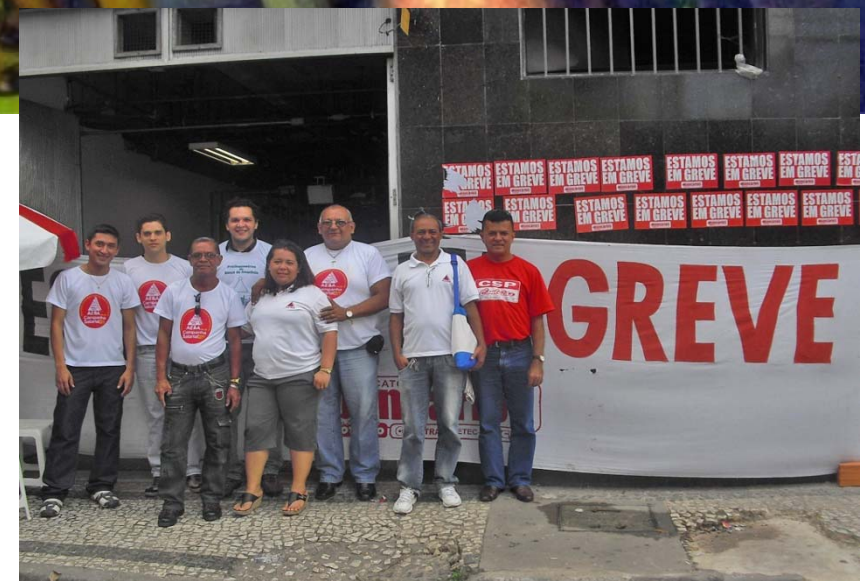
■ Bancários e funcionários dos Correios no Pará protestaram ontem na avenida Presidente Vargas