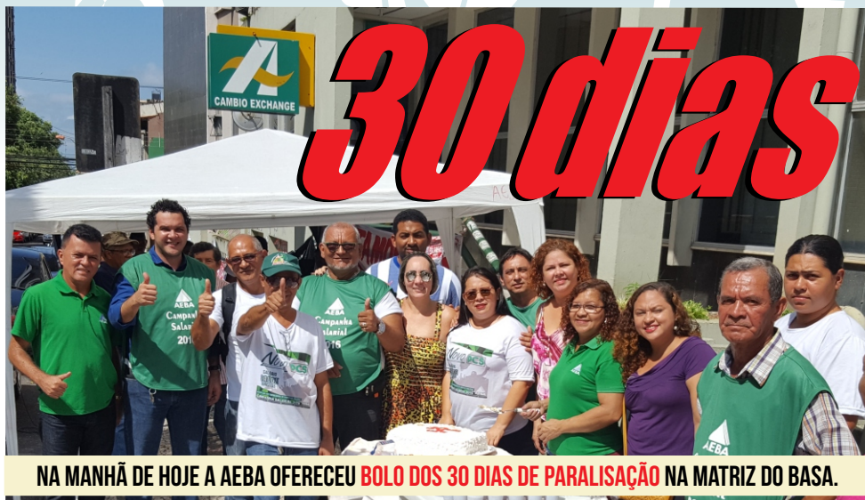
NA MANHÃ DE HOJE A AEBBA OFERECEU BOLO DOS 30 DIAS DE PARALISAÇÃO NA MATRIZ DO BASA.

Hoje nossa Greve chega ao 30º dia, depois de amanhã faremos a mais longa Greve Nacional das últimas duas décadas. Neste momento enfrentamos uma ofensiva dos banqueiros e do governo, cujo projeto é impor à nossa categoria uma política de redução salarial.